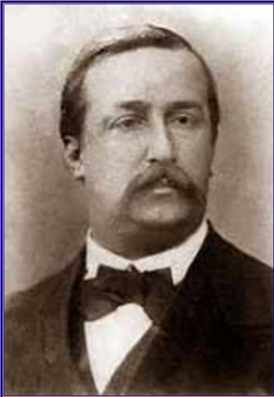
Александр Порфирьевич Бородин